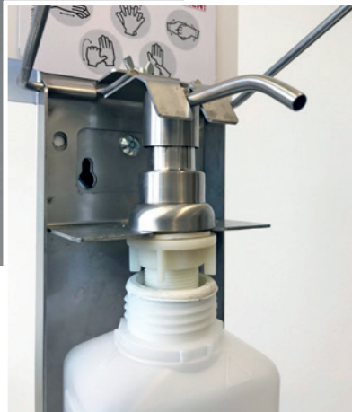
IM INNERN DES SPENDERS