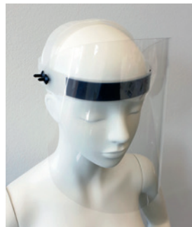
FACE SHIELD HELMET