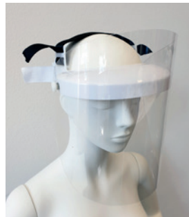
FACE SHIELD COMFORT MED