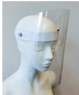
FACE SHIELD COMFORT